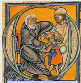
Un padre affida il figlio a un convento, miniatura (XII sec.)

Anche la Chiesa seppe inserirsi pienamente nel sistema vassallatico