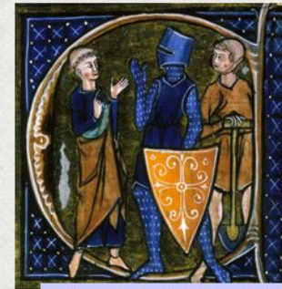
I tre ordini, miniatura (XIV sec.)

Al vertice si trovava il re , il cui potere sacro garantiva l'equilibrio della società